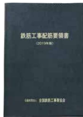
鉄筋工事配筋要領書