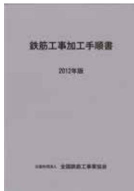
鉄筋工事加工手順書