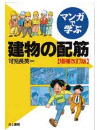
マンガで学ぶ建物の配筋