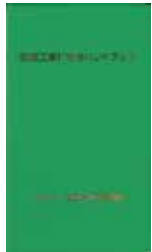
鉄筋工事打合せ ハンドブック