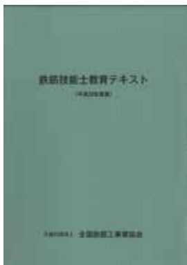
鉄筋技能士教育テキスト