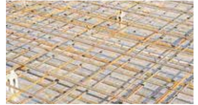
・見やすく解りやすい施工指示