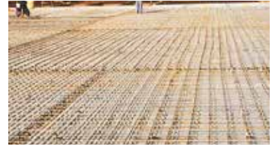
・施工後の確認も一目でチェック